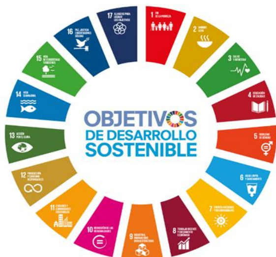
Figura 5. ODS establecidos por la ONU.

La propuesta debe estar alineada al menos a una de las metas propuestas en la Agenda 2030, que se divide en 17 objetivos de desarrollo sostenible (ODS), establecidos por la Organización de las Naciones Unidas (ONU).