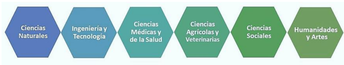
Figura 1. Áreas de la Ciencia según el Manual de Frascati.

Organización de las Naciones Unidas para la Educación la Ciencia y la Cultura (UNESCO)