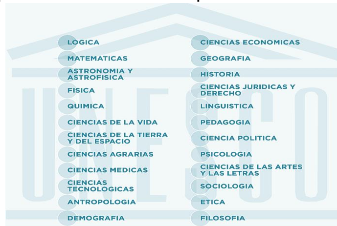
Figura 2. Campos de la Ciencia definidos por la UNESCO

Nomenclatura para el Análisis y Comparación de Programas y Presupuestos Científicos (NABS en inglés):